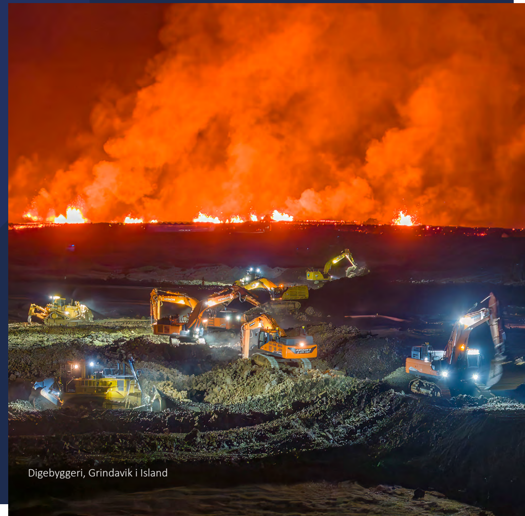
Digebyggeri, Grindavik i Island

Per Aarsleff Holding A/S www.aarsleff.com CVR-nr. 24257797 Delårsrapport for 1/10-31/12 2023. Selskabsmeddelelse nr. 8 / 27.02.2024